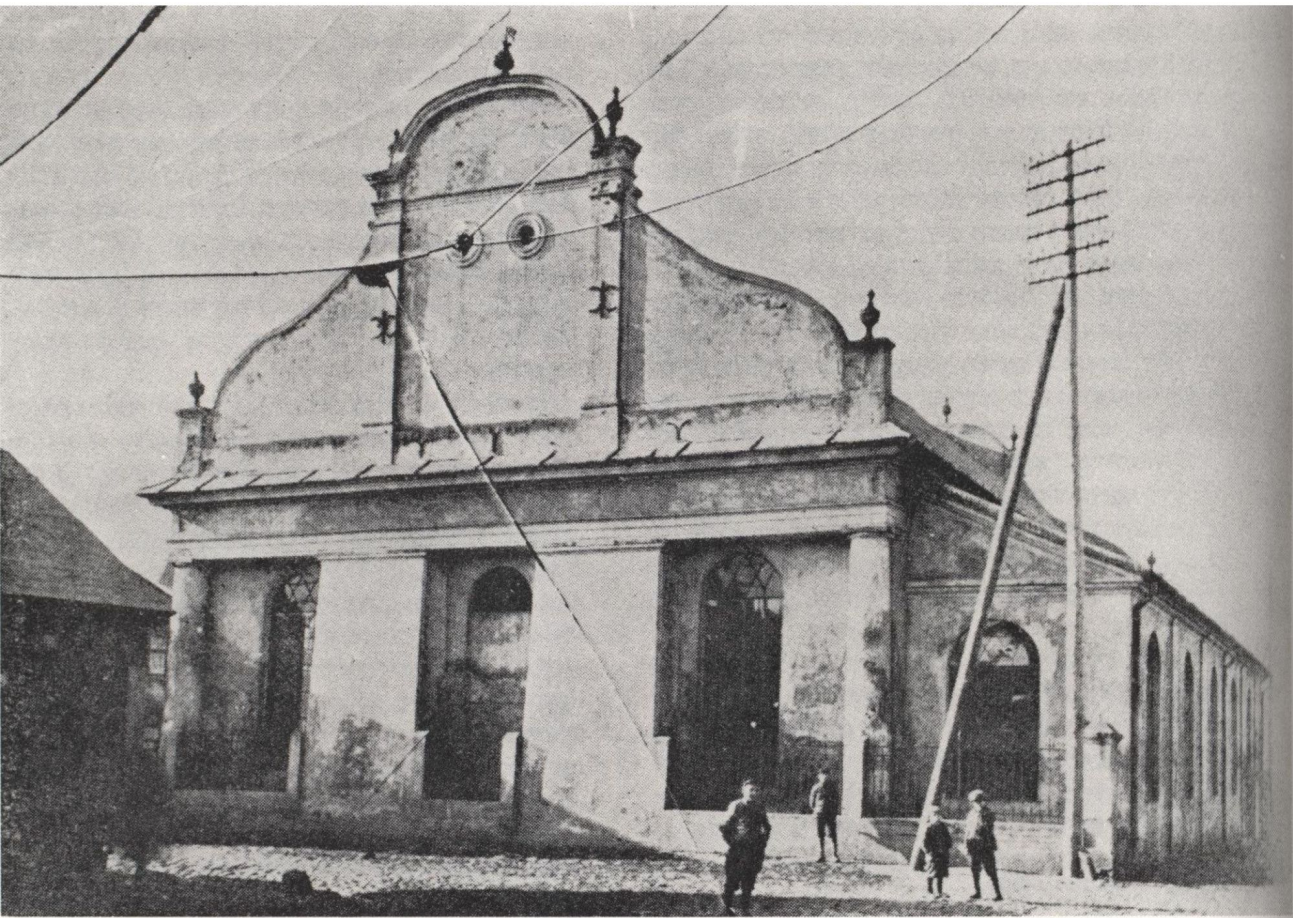
קוטסו, בית הכנסת (הצילום משנות ה־30)